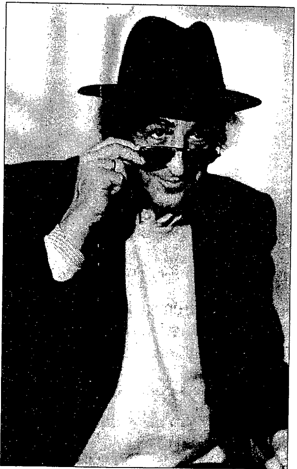
Giorgio Gaber, da domani al Grande con il suo spettacolo